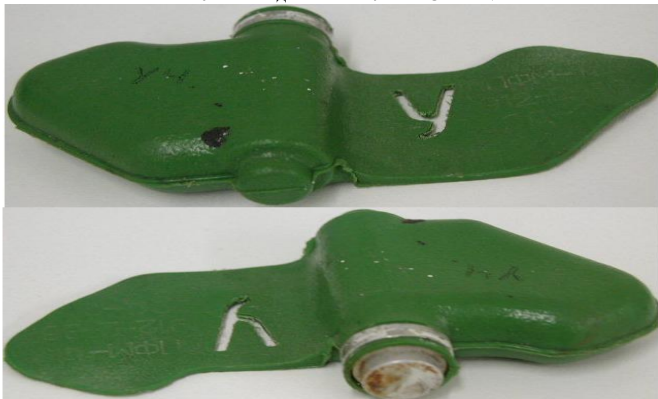
Внешний вид « Ми́ны – ЛЕПЕСТКА »:

Масса мины 80 грамм, размеры – 12 x 6 сантиметров, чувствительность мины лежит в пределах 5-25 кг, что вполне достаточно для срабатывания от веса маленького ребенка.